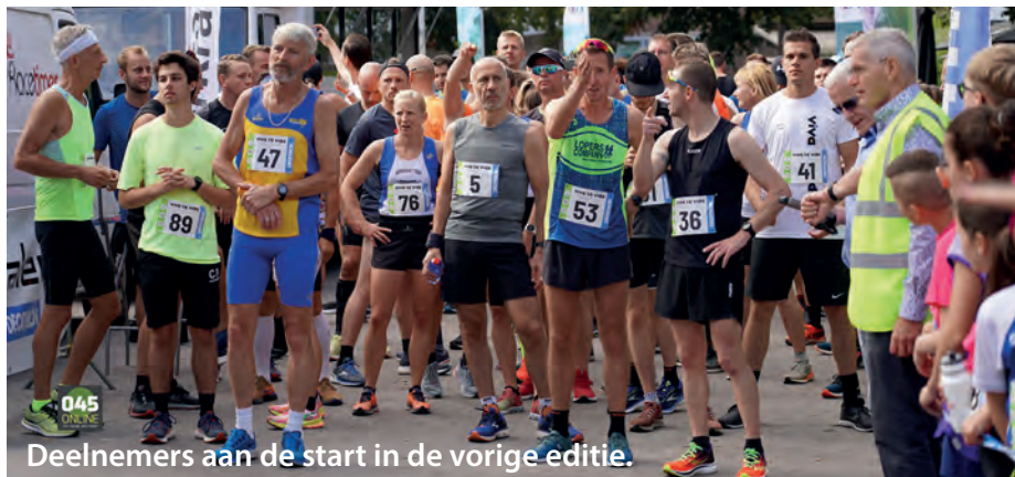
Deelnemers aan de start in de vorige editie.

Voor meer informatie over dit hardloop- en wandelevenement is een speciale website ontworpen www.vivalavidarun.nl . De voorinschrijving via www.inschrijven.nl is al gestart en sluit op 17 september.